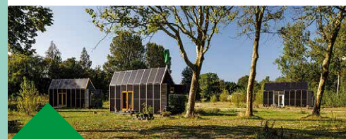
31 Tijdelijk buurtschapje met Tiny Houses Locatie: Zwemmerslaan

Een experimenteel verplaatsbaar project waar geëxperimenteerd wordt met off-the-grid wonen. De verplaatsbare Tiny Houses hebben een dak en een gevel op het zuiden van PV- en PVT-panelen om zo zelf de energie op te wekken voor de warmtepomp. Ook bevatten de huisjes een eigen waterzuivering met aan de kopse zijde van het huis filterbakken met waterzuiverende planten.