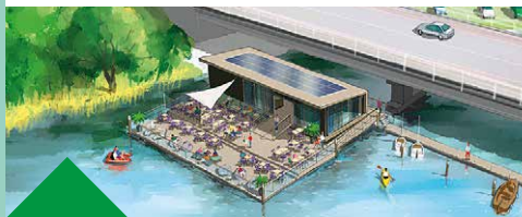
27 Waterpaviljoen Put van Vink Locatie: Witte bruggetje Jaagpad Schouwbroekerbrug

Een drijvend horecapaviljoen kan van de idyllische Schouwbroekerplas een aantrekkelijke plek voor wandelaars en fietsers maken. Vanaf het terras genieten van het weidse uitzicht op deze 'Put van Vink'. Waterrecreanten kunnen hun bootjes aanleggen aan drijvende steigers. De Stichting Leven Op Water voert het duurzaam uit met oog voor de groene omgeving.