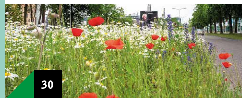
30 Natuur versterken Schalkwijk

Van oudsher beoefenden woonwagenbewoners ambulante beroepen en trokken met het hele gezin van plaats naar plaats. In 1968 werden zij verplicht om op aangewezen plekken te staan. Nu wonen, werken en leven zij het liefst met de gehele familie in woonwagens op één locatie. Er is sociale cohesie; er is geen bel, de deur staat altijd open. Sinds 2014 staat de woonwagencultuur op de UNESCO-lijst (bescherming immaterieel erfgoed).