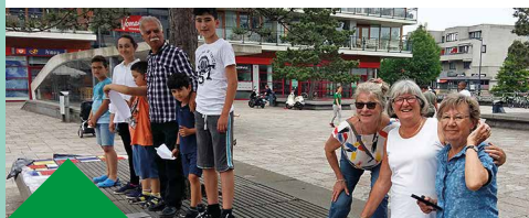
28 Make-over Da Vinciplein Locatie: Bernadottelaan t.o. 209

Plannen genoeg om het plein op te vrolijken en er een levendige ontmoetingsplek van te maken. Wat nu een grijs en slordig plein is, krijgt meer kleur. Voor het zwerfafval zijn alvast grotere afvalbakken geplaatst. Naast de bestaande mozaïek banken, is de wens om met geld van 'Schalkwijk aan Zet' ook de banken rond de nooduitgang van de parkeergarage met mozaïek te bekleden.