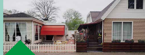
29 Kleine woonwagenlocatie Locatie: Amelandstraat 15

Van oudsher beoefenden woonwagenbewoners ambulante beroepen en trokken met het hele gezin van plaats naar plaats. In 1968 werden zij verplicht om op aangewezen plekken te staan. Nu wonen, werken en leven zij het liefst met de gehele familie in woonwagens op één locatie. Er is sociale cohesie; er is geen bel, de deur staat altijd open. Sinds 2014 staat de woonwagencultuur op de UNESCO-lijst (bescherming immaterieel erfgoed).