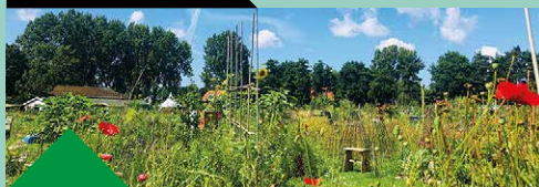
23 Buurttuin Schalkwijk Locatie: Belgiëlaan t/o Vrij Waterland, klein bruggetje

De biologische buurttuin was ooit voetbalveld en is nu natuur-domein voor buurtbewoners en passanten. Ook dieren, vogels, bijen en vlinders hebben het landje gevonden. Kom kijken naar de moestuinen, de plukweide en de kleutertuin. De buurttuin is ook belangrijk voor sociale verbinding. Zoals de Ecoring voor tieners en jong volwassenen en de Wereldtuin voor mensen uit verschillende landen en culturen.