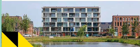
21 Vijverpark Locatie: Scarlattistraat

Vijverpark wordt een aantrekkelijke wijk met ruim 400 woningen, van appartement tot vrijstaand, van sociale huurwoning tot vrije sector koop. Allen gelegen in een zorgvuldig ontworpen en aantrekkelijke openbare ruimte.