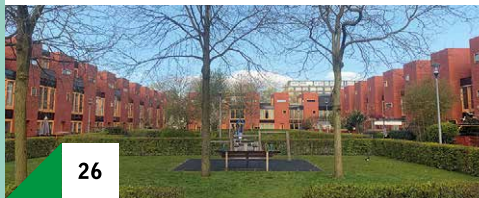
26 Drie Hoven Monacopad Locatie: Pleintje Luxemburgerstraat 25 Tijd: tot 13.30 uur

Het project uit 2005 omvat drie hoven rondom binnentuinen. Het seniorenhof van Elan Wonen is privé met een bloemen- en plantentuin. Het openbare Heemhof heeft huurwoningen en een kinderdagverblijf. Het gezinshof bestaat uit eengezinswoningen rond een parkje met speeltoestellen en picknicktafels. De hoven vormen een eenheid door het gebruik van kleuren en materialen. Het gezinshof is tot 13.30 uur open.